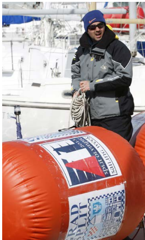
U petak su bove ostale na kopnu