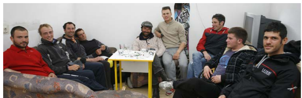
U susjednom Mornaru momci su čakulom kratili vrijeme

IMPRESSUM: Sandra Barčot, Igor Čaljkusić, Danni Matijaca, Rudolfa Širola Kliškić, Augustin Gattin