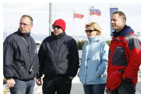
Čelnici kluba Labud, domaćina regate