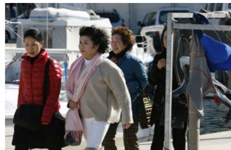
I gošće iz Japana su osjetile snagu bure