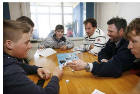
Mađari u zanosu igre