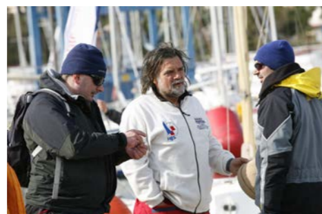
A kad ćemo više na more?