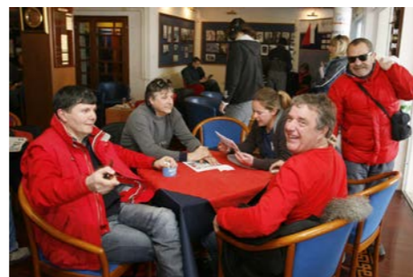
Bilo je dovoljno vremena i za priču